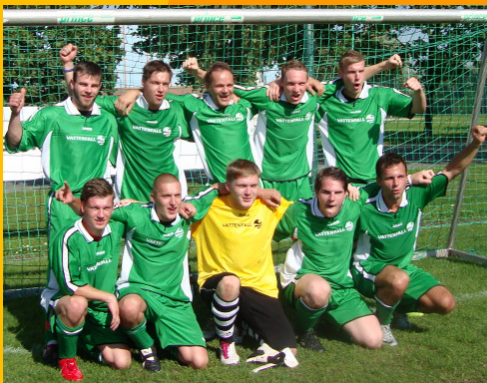
unsere siegreichen Fußballer