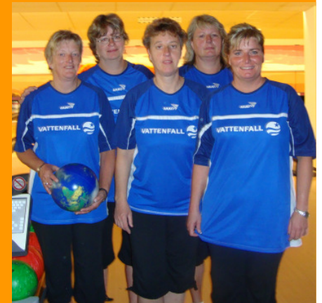
unsere erfolgreichen Bowling-Damen